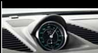
Design-Zitat: Bis 1967 war die Ziffern- und Skalenfarbe der Instrumente grün und die Zeiger weiß.

Schon von außen ist die klassische 911 DNA unverkennbar: z. B. an den rund ausgeformten Scheinwerfern und den Lufteinlasslamellen. Im Jubiläumsmodell sind sie zusätzlich mit Chrom akzentuiert, genau wie das Heckdeckelgitter hinten. Es verrät, wo der Motor sitzt: Sechs Zylinder, in Boxeranordnung, inklusive typischem Porsche Sound. So weit die Tradition. Doch kommen wir zur Zukunft: Denn mit dem Motor des Porsche 911 Carrera S bewegt sich das Jubiläumsmodell eindeutig auf dem neuesten Stand der Zeit. Mit 3,8 Litern Hubraum entwickelt der Motor eine beeindruckende Leistung von 294 kW (400 PS). So beschleunigt das