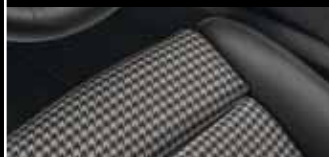
Liebvolle Reminiszenz: Die Sitzmittelbahnen greifen das Pepita-Muster auf, das in den ersten 911 Modellen stilbildend war.