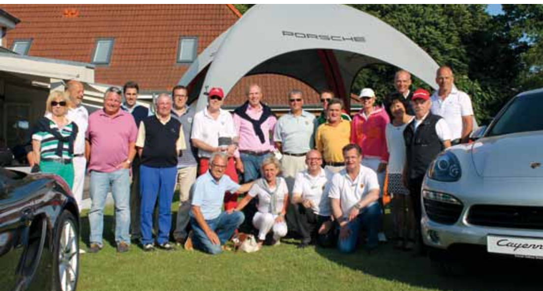
Wir gratulieren allen Gewinnern unseres Golf-Turniers!

Vor den Toren Bremens erstreckt sich der Golfplatz Syke über ein leicht hügeliges Gelände. Ca. 20 Autominuten südlich von Bremen gelegen, passt er sich sehr harmonisch an die reizvolle Geestlandschaft an. Eingerahmt von Wald umgibt ihn ein Panorama, das bei gutem Wetter eine Sicht bis auf die Silhouette von Bremen freigibt.