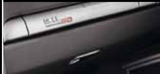
Oberhalb des Handschuhfachs zeigt eine Plakette die Limitierungsnummer an.