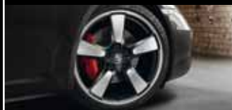
Nicht nur von Sammlern hochbegehrt: die Sport Classic Räder im legendären Fuchselgendingen.

Jubiläumsmodell 50 Jahre 911 mit 7-Gang-Schaltgetriebe in 4,5 s von 0 auf 100 km/h und erreicht eine Höchstgeschwindigkeit von 298 km/h. Ebenfalls zukunftsweisend sind die Verbrauchswerte, die der hohen Leistung des Jubiläumsmodells gegenüberstehen: Denn mit 8,7 l/100 km (in Verbindung mit dem optionalen PDK) liegen sie vergleichsweise niedrig. Grund dafür sind serienmäßige Effizienztechnologien wie Auto Start-Stop-Funktion, Thermomanagement oder Bordnetzrekuperation, die auch im Jubiläumsmodell 50 Jahre 911 integraler Bestandteil des Fahrzeugkonzepts sind.