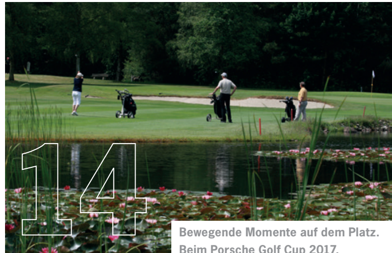
Bewegende Momente auf dem Platz. Beim Porsche Golf Cup 2017.