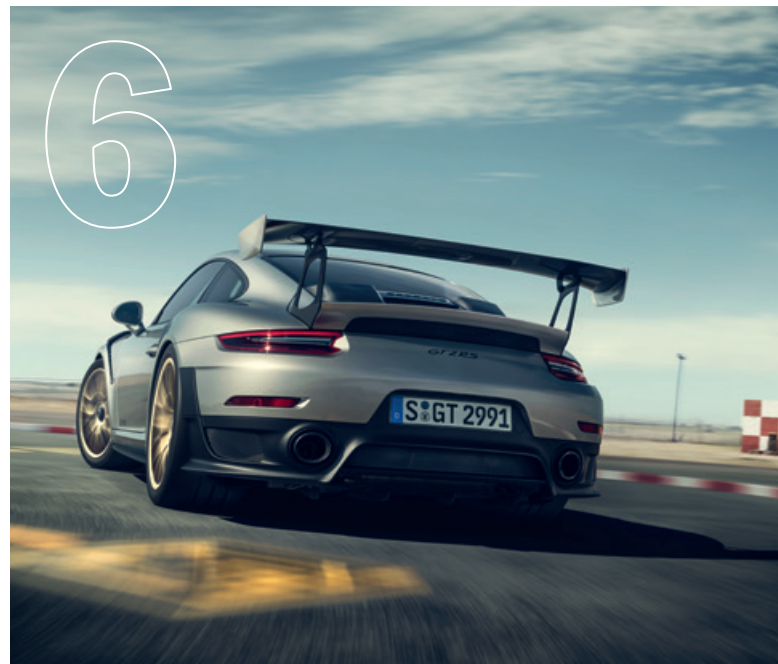
Lässt seinen Worten Taten folgen. Der neue 911 GT2 RS.