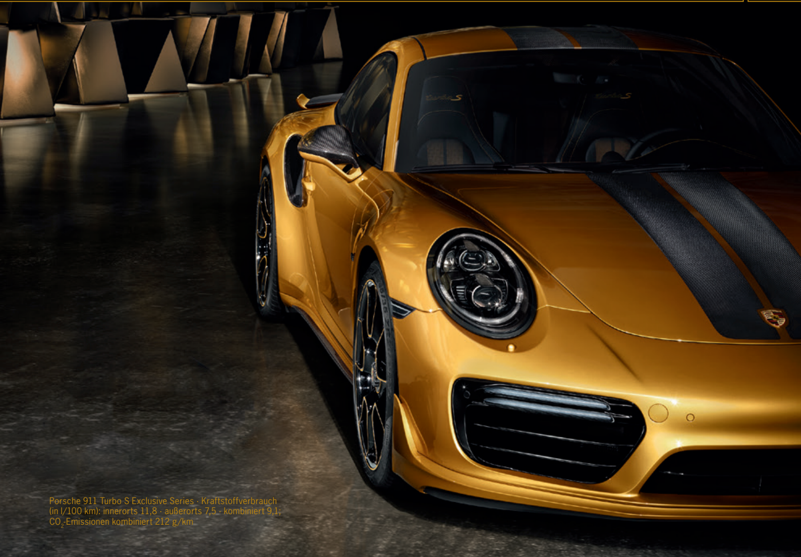
Porsche 911 Turbo S Exclusive Series · Kraftstoffverbrauch (in l/100 km): innerorts 11,8 · außerorts 7,5 · kombiniert 9,1; CO 2 -Emissionen kombiniert 212 g/km